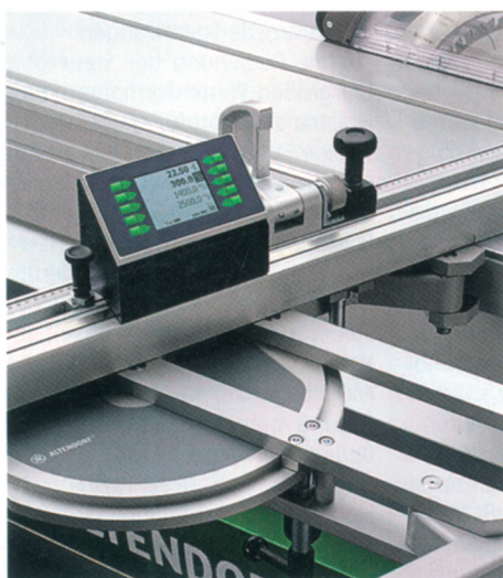
Der speziell für den neuen Parallelogramm-Querschlitzen entwickelte Winkelgehrungsanschlag: Alles im Blick mit Digit LD

Bei der Konstruktion des neuen Parallelogramm-Querschlitzens PQS achteten die Entwicklungs-Ingenieure insbesondere auf die Qualität der Führungen. Verschleißfreie Nadellager garantieren Maßgenauigkeit bei allen Winkelschnitten. Die in den Querschlitzen integrierte Linearführungseinheit erklärt die Leichtgängigkeit des Systems. Das Umsetzen des Anschlags erfolgt mit wenigen Handgriffen durch das Lösen von zwei Klemmhebeln, ein Abheben des Anschlags ist somit nicht notwendig. Die massive 90°-Verriegelung des PQS garantiert eine sichere Reproduzierbarkeit des rechten Winkels. Der Anschlag ist beidseitig von 0 – 47° schwenkbar, der Schwenkwinkel wird auf 1/100° genau im integrierten Digitaldisplay angezeigt. Ebenfalls integriert: der Längenausgleich, der bei Schwenkung des Anschlags einfach per Skala erfolgt. Das Ablängen am neuen