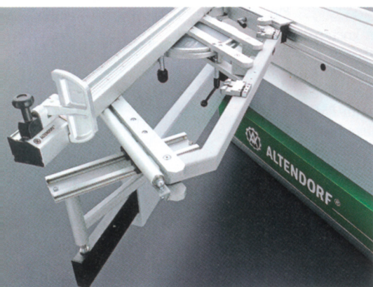
Der neue Parallelogramm-Querschlitzen: Stabil und präzise

Altendorf GmbH & Co. KG 32429 Minden www.altendorf.com